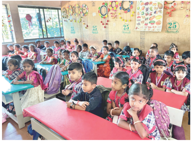
Tolik žáků tedy paní ředitelka ve třídě v Bartošovicích opravdu nemá.