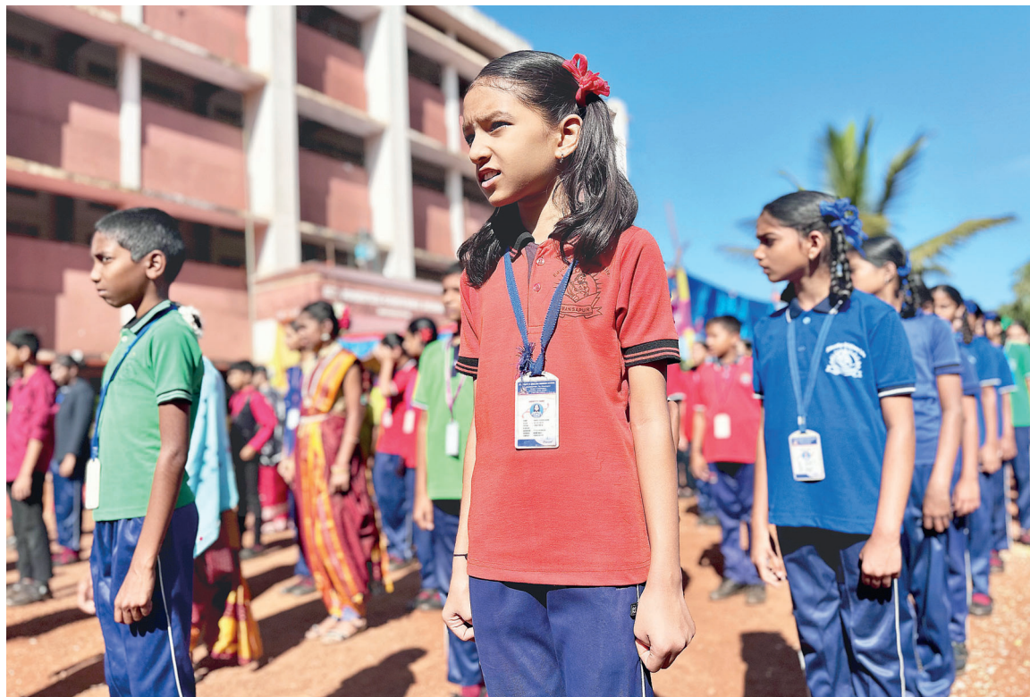
Žáci ve škole sv. Josefa v indickém Mansapuru.

HLEDÁME 1 000 MARIÍ. Když tisíc Marií (s podporou Josefů) daruje po tisíci korunách, pomohou rozšířit kapacitu školy pro chudé děti v Indii, a tím splnit nové požadavky na její provozování. Najděte si svou Marii, se kterou přispějete na tuto sbírku! Děkujeme!