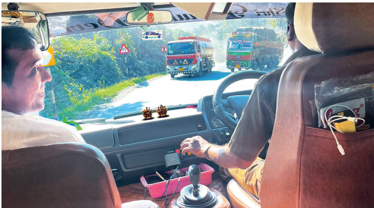
Z dopravy v Indii nám vstávají vlasy na hlavě. Indové se jen smějí.

nepřicházejí. Není výjimkou, že děti mluví čtyřmi nebo pěti jazyky, přepínají mezi nimi naprosto přirozeně.