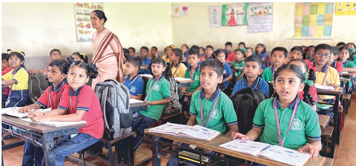
Ve třídách je úplně plno. V některých sedává až 67 dětí.

S Božím požehnáním a vaší velkou pomocí věříme, že vše šťastně zvládneme!