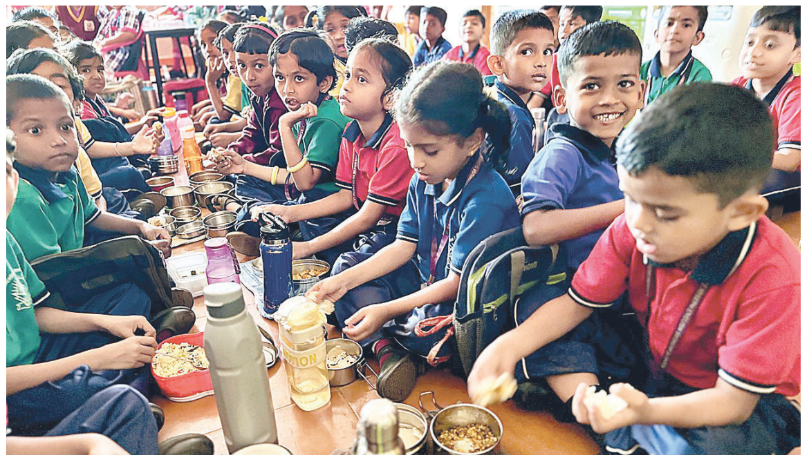
Návštěva z ČR dá zabrat, a tak je potřeba se trochu posilnit.

První, čeho si všimnete po vstupu do školy, je klid. Ne ticho vynucené strachem, nýbrž soustředění. Děti dávají pozor, reagují, zapojují se. Ve třídách jich bývá klidně padesát a bez určitého řádu by to ani nešlo. Přesto to nepůsobí jako vojenský režim. Učitelé jsou přísní, ale spíše důslední než tvrdí. To hlavní, co je za tím cítit, je vnitřní motivace žáků.