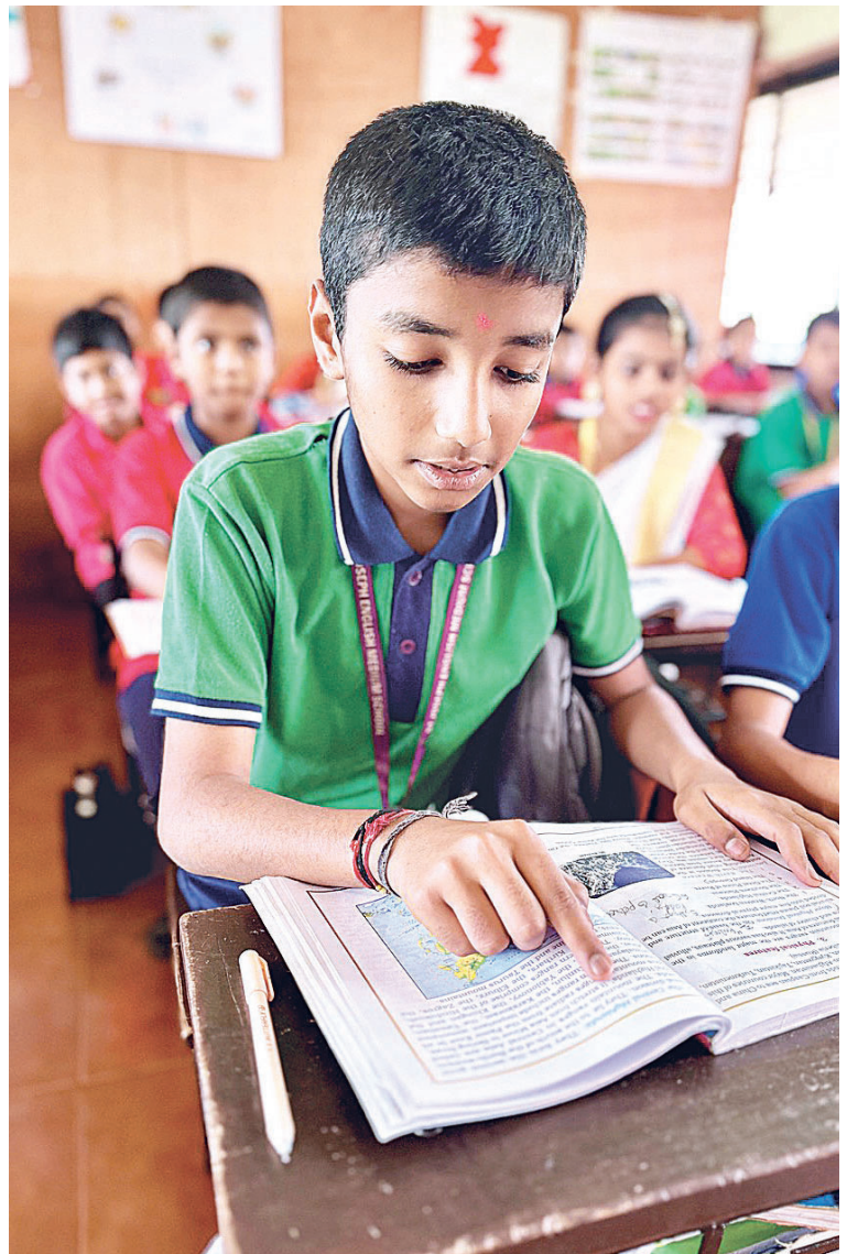
Student ihned poznal, že ho sleduje ředitelské oko...