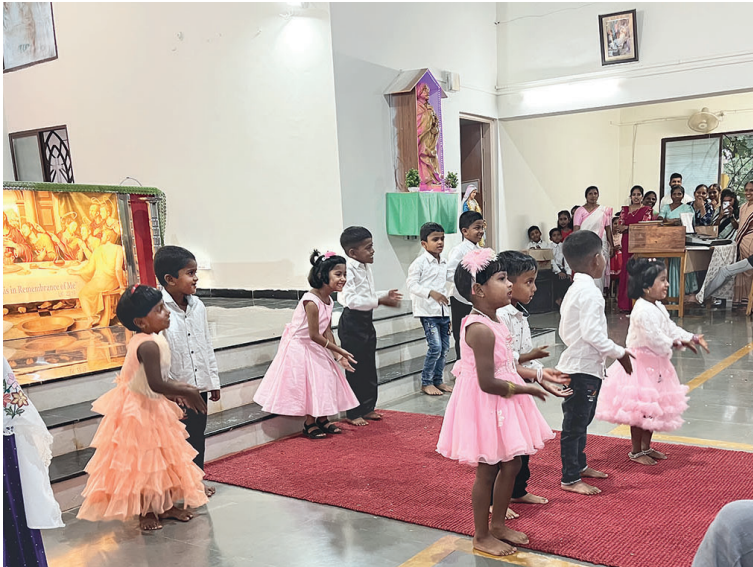
Mše v Indii jsou plné tance a zpěvu.